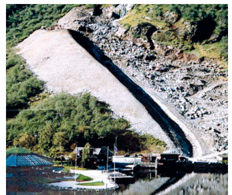
Ledevoll i Gudvangen.