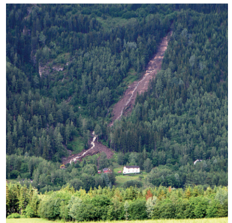
Vannutløst skred ved Rud i Hallingdal, juli 2007.