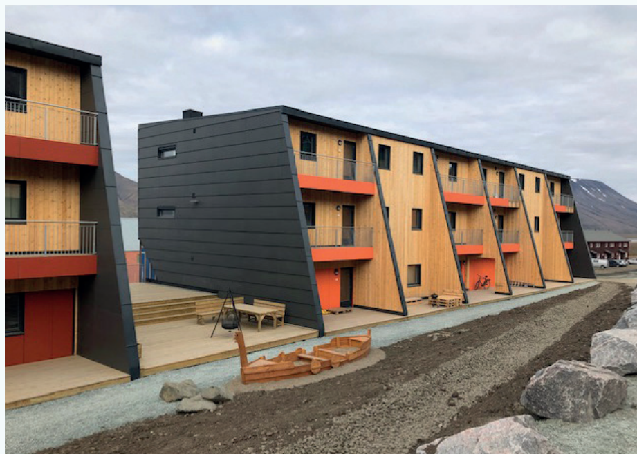
Dei seks nye bustadblokkene til Statsbygg i Longyearbyen er eit av pilotprosjekta i SFI Klima 2050 med smart dampsperre i yttertaka. Blokkene er bygd som modular av Skanska Husfabrikken.

Sjølv om eventuell høg byggfukt ved lukking av konstruksjonen kan tørke til innelufta, kan det avhengig av årstid ta noko tid. For å unngå risiko for muggvekst i denne tidlegfasen er det viktig med god kontroll av trefuktigheita undervegs i byggeprosessen. For våre pilotprosjekt sette vi eit krav om at trefukta i takmateriala skulle vere under 15 vekt-% ved isolering og montasje av den smarte dampsperra. Erfaring viser at vi enkelt oppnår det ved modul og elementproduksjon, men det kan vere meir krevande